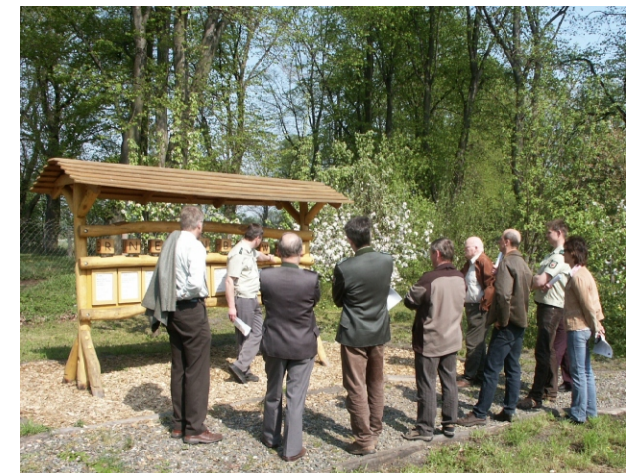
Abschluss - Holzwürfelquiz